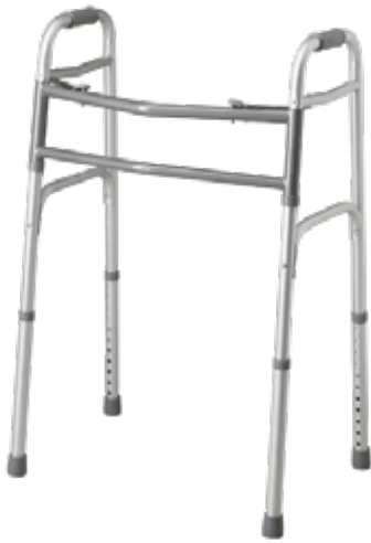
Ortopédico Andador Plateado